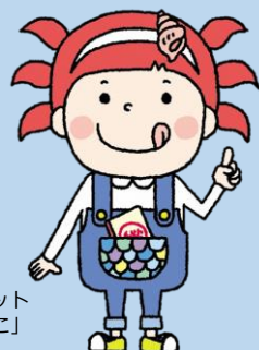
金沢の海の幸マスコット 「さかなざわ さちこ」