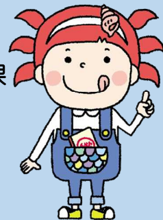
金沢の海の幸マスコット 「さかなざわ さちこ」